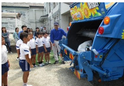
4年 “ごみ” 理解学習